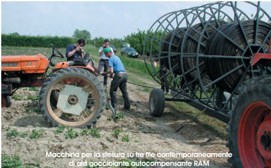
Macchina per la stesura su tre file contemporaneamente di ala gocciolante autocompensante RAM

potendo tranquillamente essere recuperate a fine raccolta.