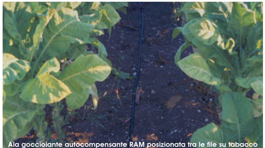
Ala gocciolante autocompensante RAM posizionata tra le file su tabacco

I primi risultati di queste prove sono molto incoraggianti anche su questa coltura e fanno sperare, nel breve termine, ad un utilizzo dell'irrigazione a goccia su patata fuori da un ambito puramente sperimentale.